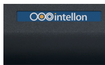
Étiquette autocollante personnalisée