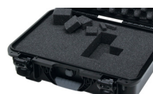
Calages de mousse cubique