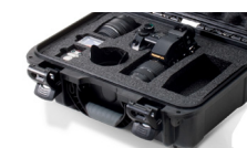
Mousse coupée sur mesure